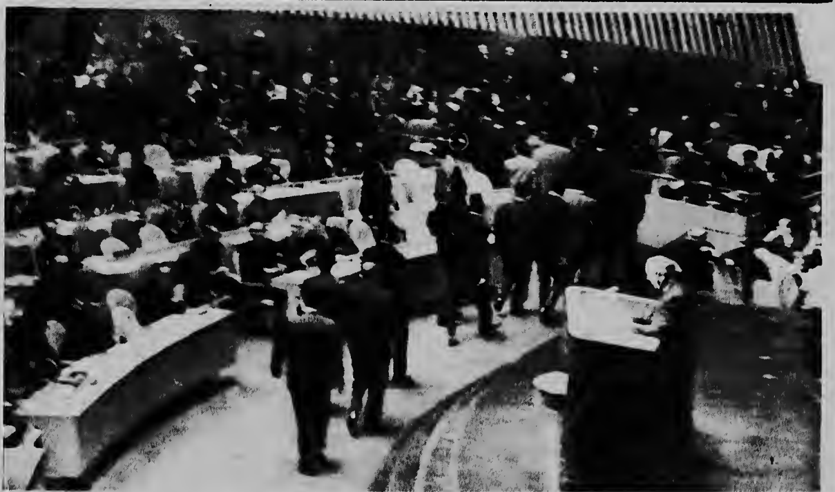
NACIONNAN UNI; Mayoria di e representantenan di e estadonan Africano a cana sali for di e reunion di Nacionnan Uni antayera ora qu promer minister Harold Wilson a dirigi palabra na e delegadonan presente. E walkout a ser organisá pa e grupo Africano, quendenan asina kier a expresa nan malcontentu cu e politica Britanica na Africa. Ya diferente pais africano a kibra relacionnan diplomatico cu Gran Bretaña pa via qu nan no a tuma medidanan mas energico contra e gobierno rebelde di Ian Smith di Rhodesia.

Ya e multitud a destrui un truck di ehercito, na cuminsamento di e desorden. E conductor di esaki a huy cu lesionnan leve. E fortificacion di e reboltosonan ta formá pa cos sushi poné riba e ruta principal entre e distrito central di e ciudad y e aeropuerto. Awe mainta autoridadnan dominicano, cu ayuda di patrullanan norteamericana, den jeep metraladora armá, a calma hopi di e espectaculonan. Pero a pesar di e limpieza di e cayanan, gruponan separá di adolescente a logra detenetransito, atacando tur vehiculo cu pasa, cu piedra.